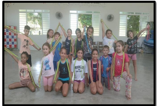
OF. DE GINÁSTICA RÍTMICA – 18/03/2026