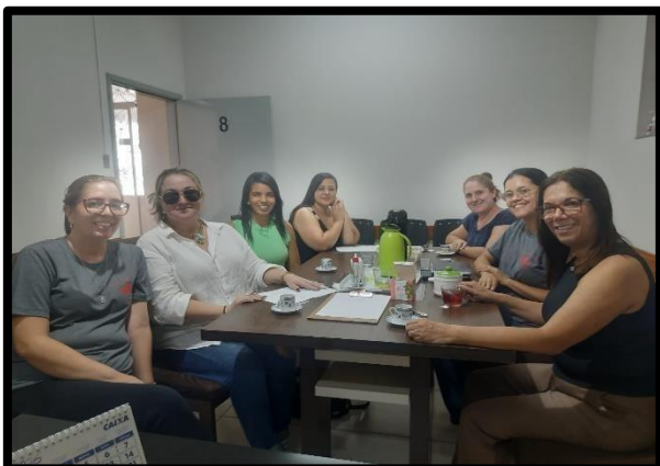
VISITA TÉCNICA SOS – 17/03/2026