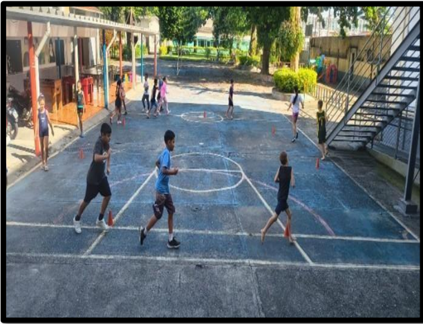
OF. DE ESPORTES – 06/03/2026