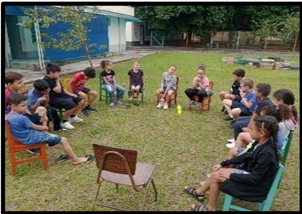
OF. DE EDUCAÇÃO SOCIOAMBIENTAL – 16/03/2026