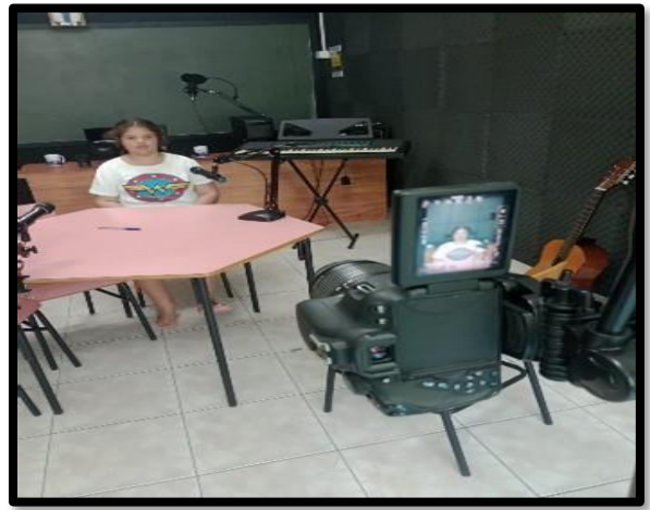
OF. DE EDUCOMUNICAÇÃO – 12/03/2026